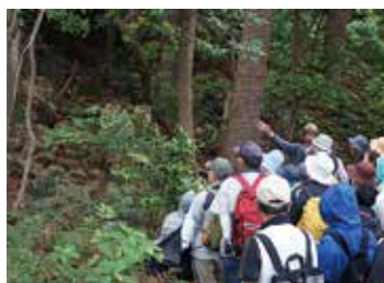
▲東伊豆ジオパーク探訪