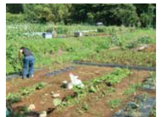
▲山田川自然の里市民農園