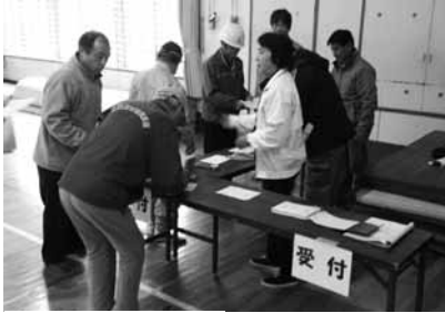
避難所開設訓練の様子