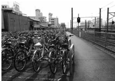
三島駅南口駐輪場