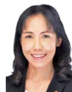
第78代副議長 つちや りえ 土屋 利絵