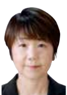
河野 月江 (日本共産党議員団)