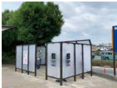
この画像はイメージです

A 令和6年3月に楽寿園事務所前喫煙所にパーテーションを設置し、受動喫煙に配慮した喫煙所を整備した。今後もし引き続き、たばこを吸う人吸わない人の権利を十分認識したうえで、快適な生活環境を保全するための施策に取り組んでいく。