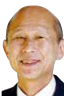
服部 正平 (日本共産党議員団)