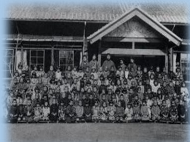
大正15年、中央幼稚園の卒園記念。 園舎は三嶋大社の東側にありました。

三島の公立幼稚園は、明治22年(1889)に「三島尋常小学校附属幼稚園」として最初の園が創設され、40人の園児と共に保育が始まりました。静岡県内では3番目です。以来130年以上の歴史があります。