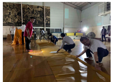
【R6に実施した夜間の避難所開設訓練の様子】

気象警報の発表又は市内で震度4以上の地震が発生した場合は、中止となる可能性があります。