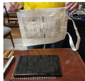
【三嶋暦印刷体験のイメージ】