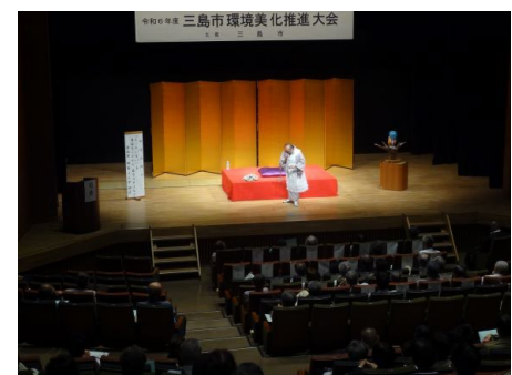
【昨年度の大会風景】

【環境美化推進大会】三島市環境市民部廃棄物対策課 〒411-0000 静岡県三島市字賀茂之洞 4703-94 担当：菅藤 TEL. 055-971-8993 FAX. 055-971-8994 e-mail : haitai@city.mishima.shizuoka.jp