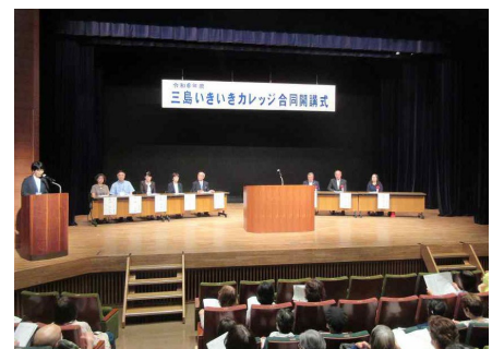
【令和6年度開講式の様子】

三島市教育推進部 生涯学習課 〒411-0035 静岡県三島市大宮町1-8-38 担当：水口 TEL. 055-983-0881 FAX. 055-983-0870 e-mail：syougai@city.mishima.shizuoka.jp