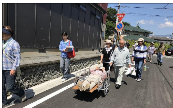
【平成30年富士ビレッジ自治会での避難の様子】

訓練の流れについては、 別紙 「訓練実施のフロー」のとおり ア 情報伝達訓練（必須） イ 避難訓練（任意） ウ 市民避難行動マニュアル（任意）