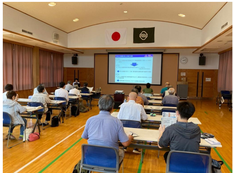
【わたしの避難計画普及員養成講座】