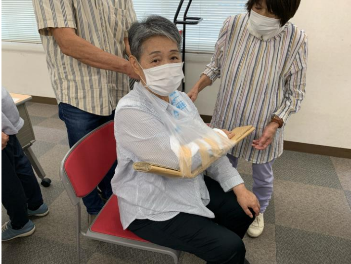
【市民トリアージと身近なものを使った応急手当】