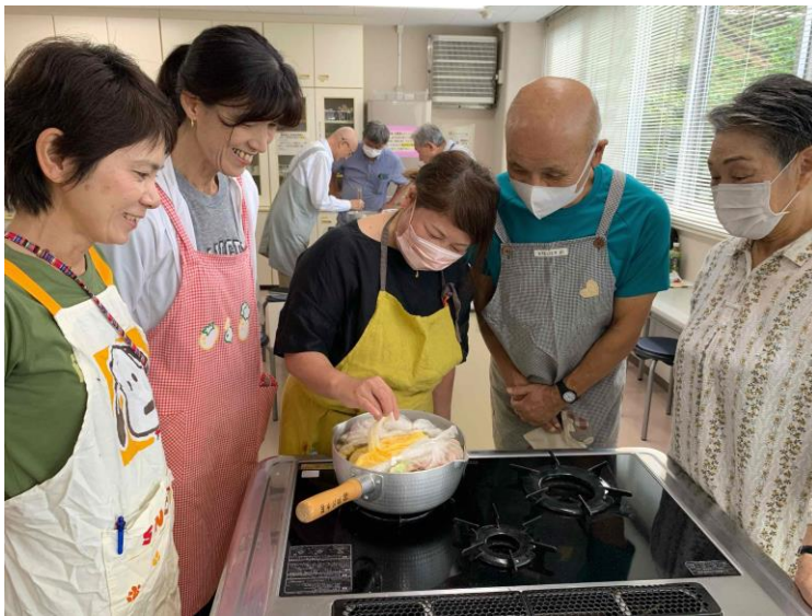
【防災クッキング～災害時に役立つ調理方法～】