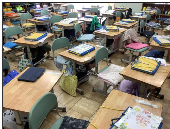
【三島市立南小学校】