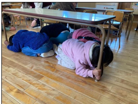
【三島市立南幼稚園】

団体・個人名、参加人数、個別訓練（訓練 2）の実施項目などを危機管理課（055-983-2751）まで