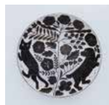
▲「鹿児島睦 まいにち」展のための器 2023年