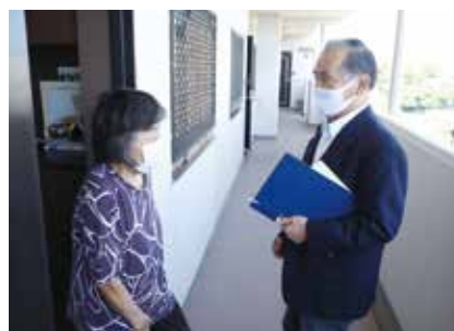
▲相談者宅を訪問する民生委員