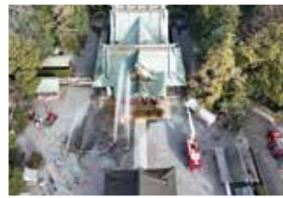
ドローン隊撮影写真（消火訓練）

令和5年6月の大雨でがけ崩れが発生した際には、さまざまな角度からの空撮により現場の状況を詳細に把握することができました。