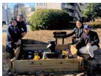
▲カップパボンと花壇

大宮町の菰池公園の付近を通るときがあったら、噴水の西側に立っているカップパボンと花壇を探してみてください。