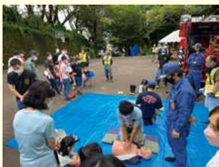
▲子ども防災フェスタの様子