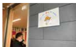
▲新設した泉町自治会館