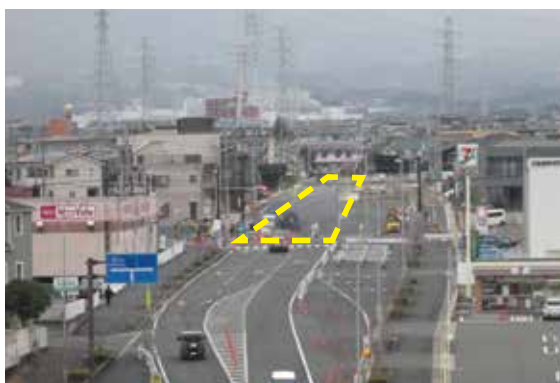
▲暫定供用する(都)谷田幸原線