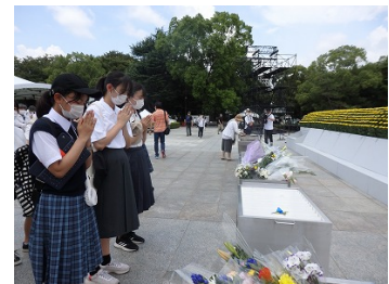
【平和記念公園での様子(令和4年度)】