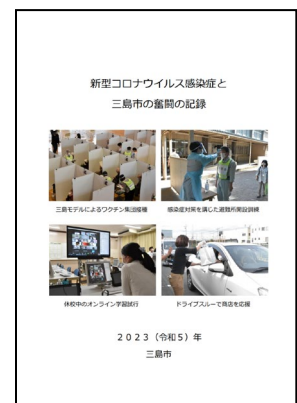
【冊子表紙イメージ】