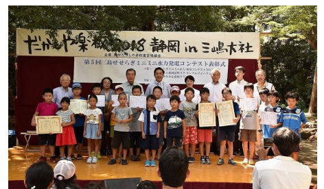
【過去の表彰式の様子】