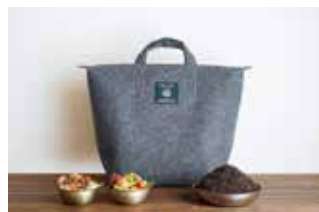
▲トートバッグ型コンポスト