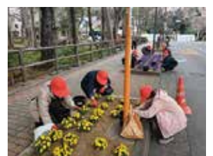
▲花壇管理作業の様子