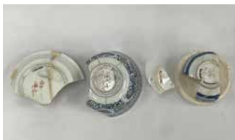
▲山中宿の発掘調査で出土した焼継ぎ

写真の器の表面に見える細い線が焼継ぎの痕跡ですが、その後新しくできた割れ口は焼き継