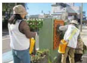
▲花飾り作業の様子