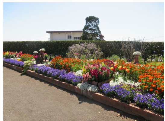
【令和7年度 市長賞受賞作品】

3月9日（月）までに電子申請、窓口または郵送にて みどりと水のまちづくり課に申込書を提出し、3月27 日（金）までに花壇のカラー写真（デジタルデータ可） を提出