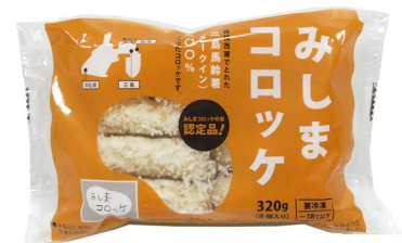
【グランプリを受賞した「みしまコロッケ」】