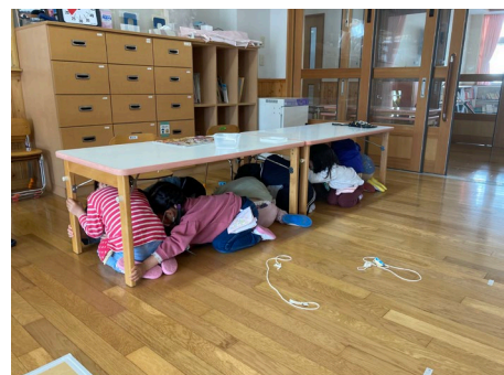
【市内幼稚園での実施の様子】

安全行動の後、避難、安否確認、情報収集・伝達、救助・救出、応急手当訓練、水・食料・備蓄品の保管場所の確認などを実施する。