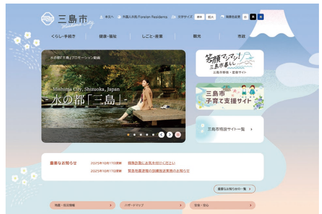
▲新しいトップページのデザイン