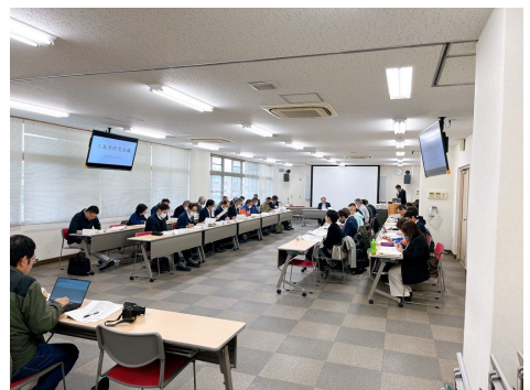
【前回の防災会議の様子】