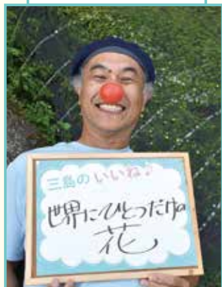
三島市福祉応援大使 めんぼーくん