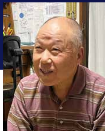
発見した小惑星に「Mishima」と名付けた

一晩に30～40カ所の画像を望遠鏡で撮影し、恒星の中を移動する小惑星を探します。見つけたものを「小惑星センター（米国）」からのデータで確認すると、ほとんどが「発見済み」のものです。根気よく観測を続けるとたまに「未発見の星」が写ってくれます。その「未発見の星」を何日も追跡撮影し、星の軌道が正確に決まると初めて「新小惑星」として認められます。それが最初の撮影から約2年後の1993年2月6日でした。