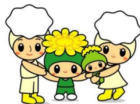
三島市療育支援室 キャラクター